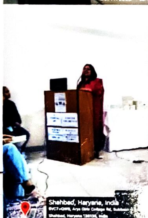
Shahbad, Haryana, India SVCT+QWB, Arya Girls College Rd, Shahbad, Haryana 136133, India