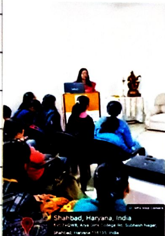
Shahbad, Haryana, India SVCT+QWB, Arya Girls College Rd, Shahbad, Haryana 136133, India