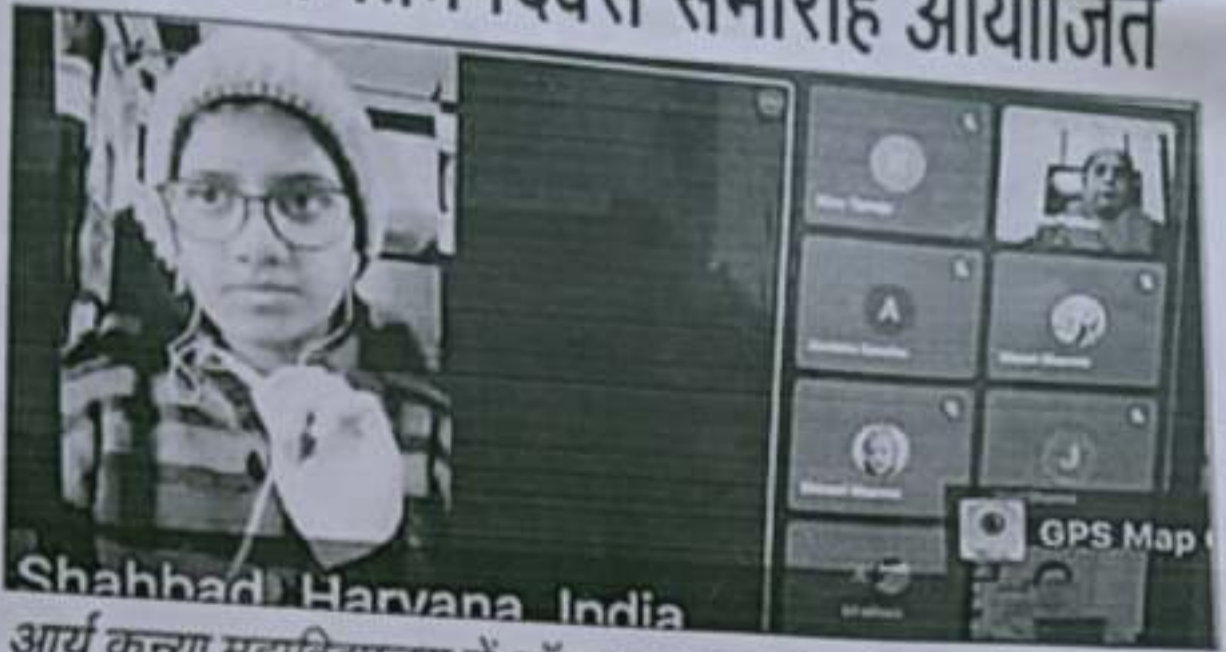
Shahbad, Harvana, India

आयं कन्या महाविद्यालय में ऑनलाइन समारोह में भाग लेते अध्यापक गण तथा छात्राएं।