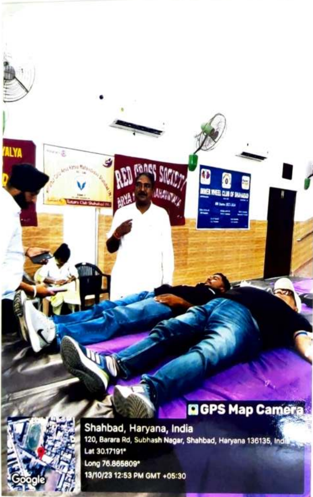
Shahbad, Haryana, India 120, Barara Rd, Subhash Nagar, Shahbad, Haryana 136135, India Lat 30.17191° Long 76.86580° 13/10/23 12:53 PM GMT +05:30