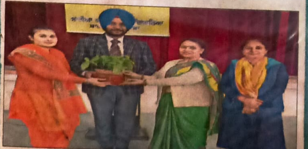
ਸ਼ਾਹਾਬਾਦ ਮੈਂ ਆਰਯ ਕਨਿਆ ਮਹਾਵਿਦਿਆਲਯ ਮੈਂ ਮੁਖਯ ਵਕਤਾ ਕਾ ਸਵਾਗਤ ਕਰਤੇ ਮਹਾਵਿਦਿਆਲਯ ਕੀ ਪ੍ਰਾਚਾਰਯ। (ਪੂਰਯ)