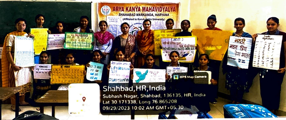
Shahbad, HR, India Subhash Nagar, Shahbad, 136135, HR, India Lat 30.171338, Long 76.865208 09/29/2023 10:02 AM GMT+05:30